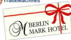
3 Tage in BERLIN für 2 Personen