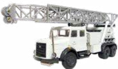
Faun-Hauber 3-axle Model:1:50