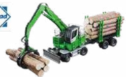
Sennebogen 735 E Model:1:50